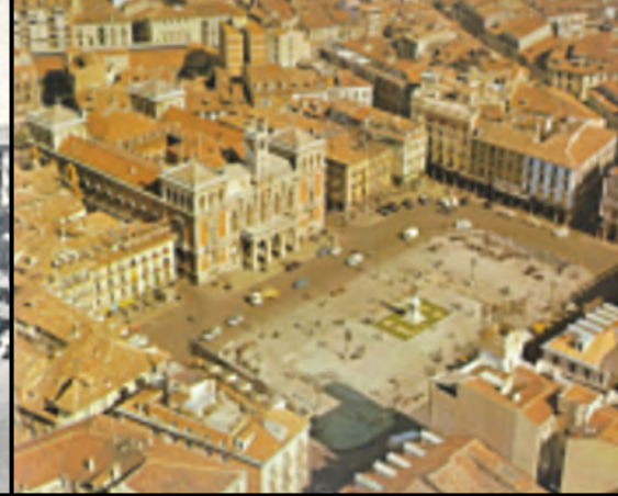
Plaza Mayor con el aparcamiento terminado y abierta al tráfico.