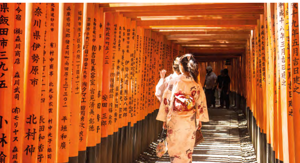
Fushimi Inari Taisha

Otra vista imprescindible es El mercado Nishiki que está compuesto por una serie de animados comercios artesanales, que atraen a diario de cientos de turistas y lugareños. Es ideal para ver toda la materia prima y especialidades locales con la que se elabora los deliciosos platos de la cocina nipona (verduras, legumbres, algas, encurtidos, especias etc..). La gastronomía japonesa es mucho más que sushi o tempura, Japón es una sabia mezcla de color, estética y sabor en lo que a comida se refiere. Es una delicia saborear desde una sopa de fideos (soba) hasta el famoso Wagyu o buey de Kobe (la carne más cara del mundo). La variedad culinaria es amplísima y lo mejor es dejarse guiar por los sentidos.