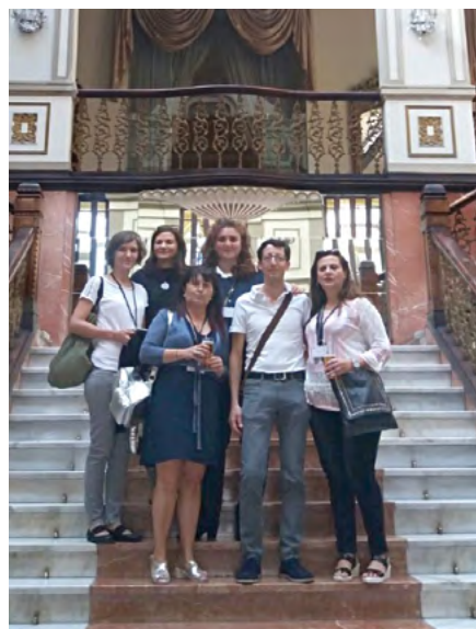
Compañeros del ICAVA que acudieron a dicho encuentro.

La próxima cita será en noviembre de 2017 en el Ilustre Colegio de Abogados de León .