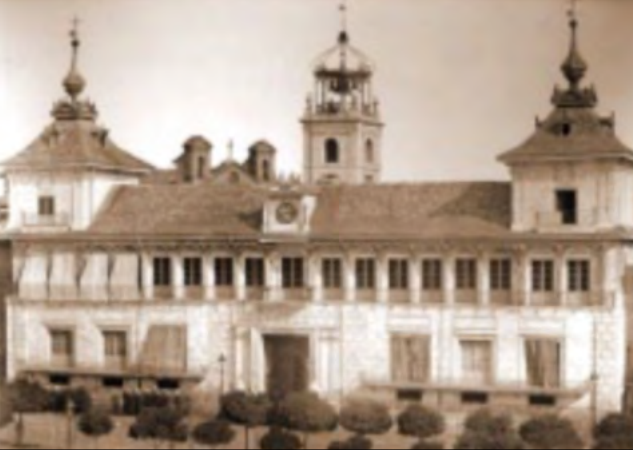
Antigua Casa Consistorial de Valladolid (1562-1879).