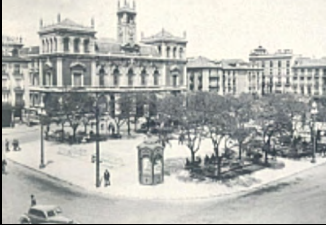
Fachada del Ayuntamiento en los 50 con el yugo y las flechas.