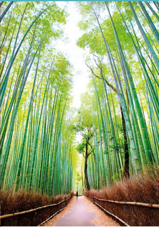
Bosque de bambu