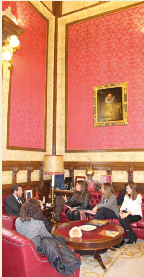
Parte de la Comisión de la Revista charla con el alcalde.