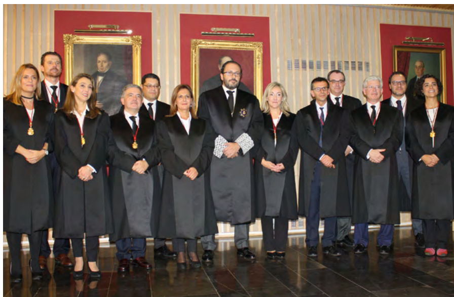
El nuevo Decano junto a los miembros de la Junta de Gobierno

El pasado año recibió la Medalla al Mérito en el Servicio de la Abogacía que entrega el Consejo General de la Abogacía Española.