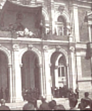
Misa inaugural del Consistorio (1908).