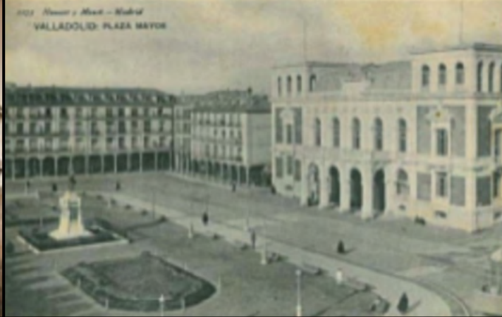
Curiosa imagen del Ayuntamiento en 1907 sin su torre.