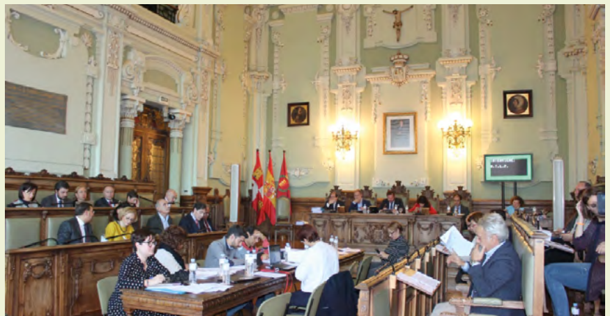
Un instante del pleno celebrado el martes 8 de noviembre en el Salón de Plenos del Ayuntamiento de Valladolid.

Y como el hambre agudiza el ingenio, el unipersonal grupo de Ciudadanos ha optado por centralizar su labor de centinela en las